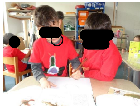
Wir malen unser Lieblingstier

Wir wünschen allen Schmetterlingskindern einen erfolgreichen Schulstart!