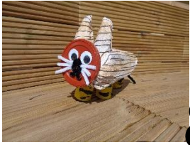
Wir basteln unser Lieblingstier