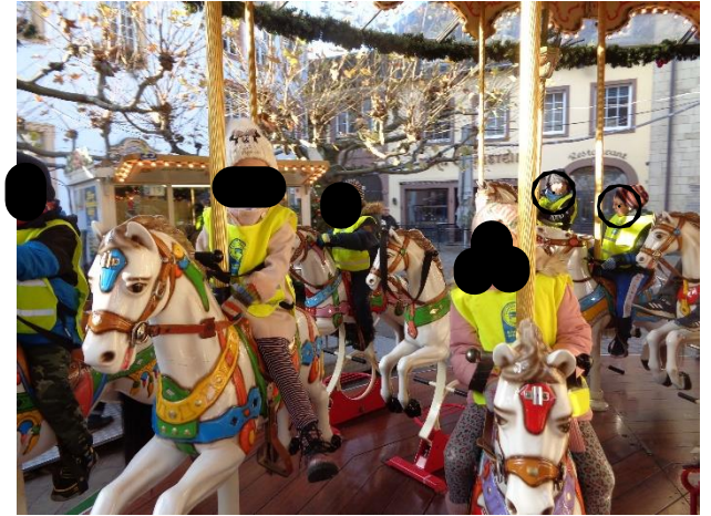
Besuch auf dem Weihnachtsmarkt