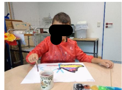
Wir malen einen Schmetterling

Wir wünschen allen Schmetterlingskindern einen erfolgreichen Schulstart!