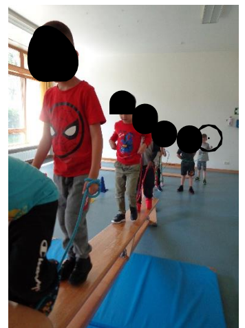
Tierspiele in der Turnhalle