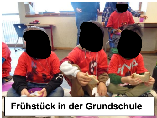
Frühstück in der Grundschule